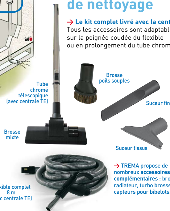
Tube chromé télescopique (avec centrale TE)

Tous les accessoires sont adaptables sur la poignée coudée du flexible ou en prolongement du tube chromé.